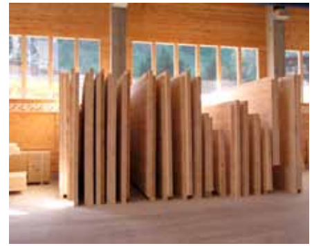
Fertig produzierte NUR-HOLZ-Elemente stehen zur Verladung bereit