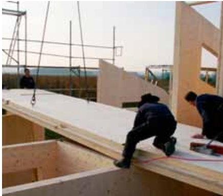
Zimmerer bei der Montage einer NUR-HOLZ-Deckenplatte

dieses NUR-HOLZ-Konzepts ist die Fügetechnik mit einer Vollholzschraube aus Buchenholz, die, zusammen mit einer entsprechenden Fertigungstechnik, entwickelt wurde. Mit ihrer Hilfe und dem in das Schraubenloch eingebrachten Innengewinde werden die einzelnen Holzlagen völlig leim- und metallfrei miteinander verbunden: keine Metallschrauben und keine Nägel, welche die einzelnen Lagen zusammenhalten. So entsteht ein umweltfreundlicher und ökologischer Baustoff.