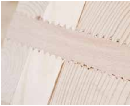
Die einzelnen Brettlagen werden mit einer Buchevollholzschraube verbunden